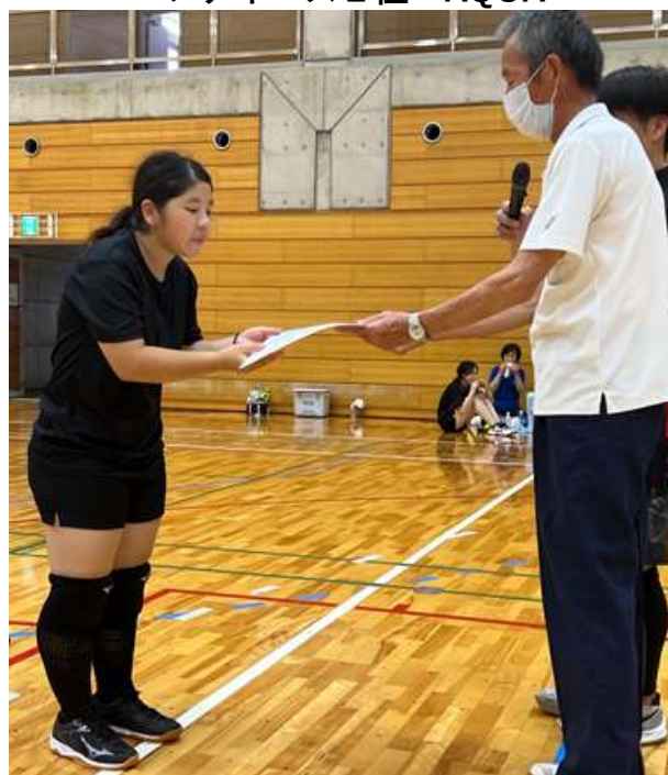
ファミリー2位：ハイキュー