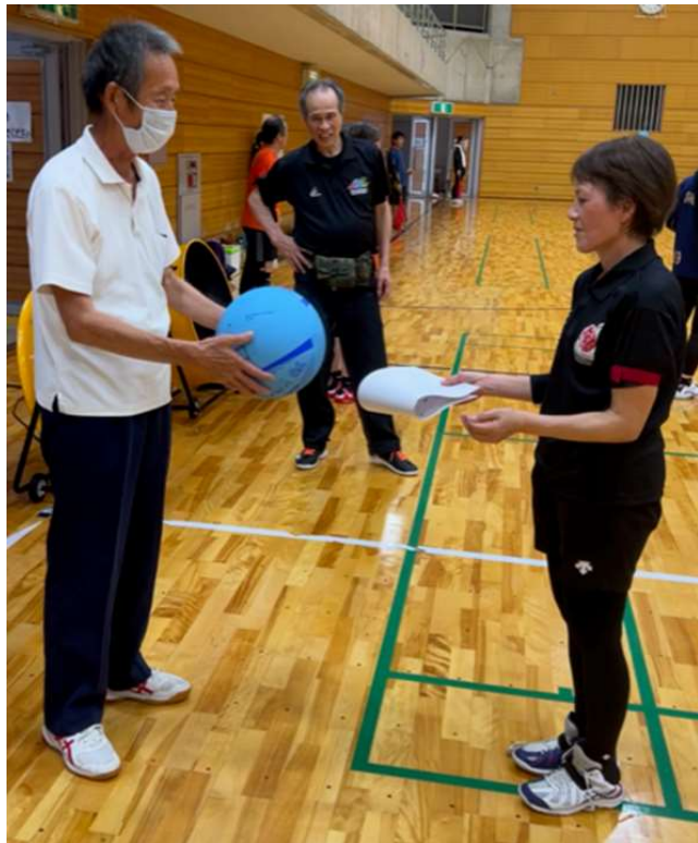
レディース優勝：三重スター姫