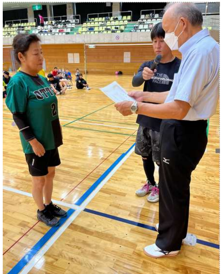
シルバーの部大分県代表：OTTO