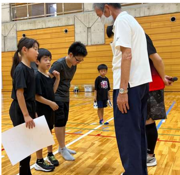
ファミリー3位：スターズ