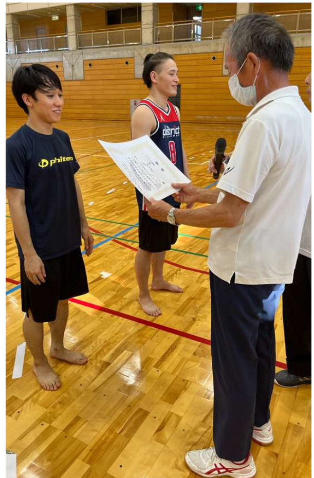
トリムA 2位：m o g