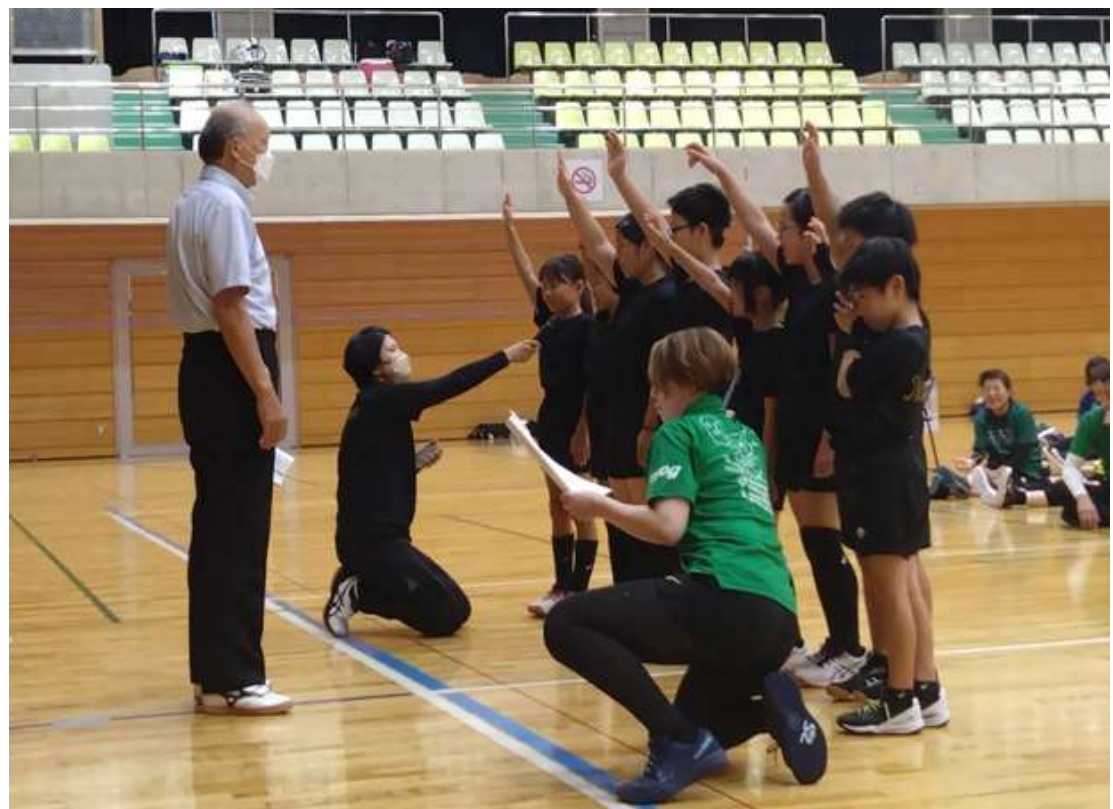
選手宣誓 (ななせジュニア)