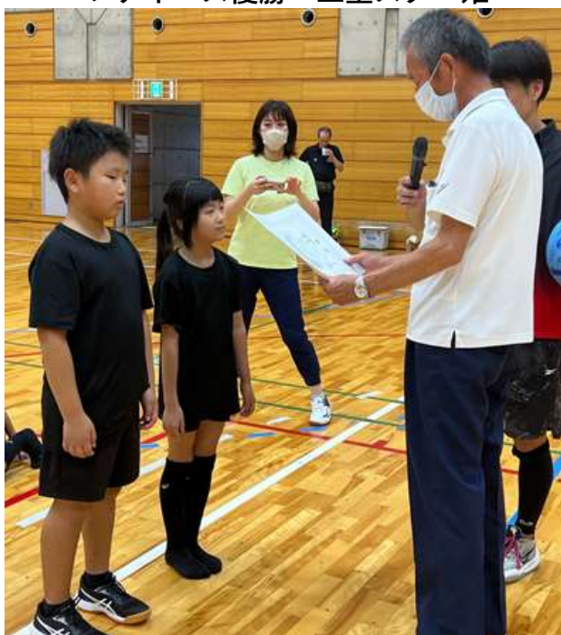
ファミリー優勝：クリスタル