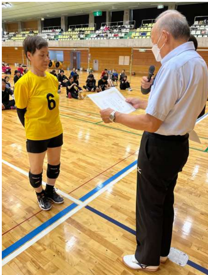
シルバーの部大分県代表：日田あさぎり 九州ブロック総合フェスティバルin沖縄 (2023年11月18日～19日)