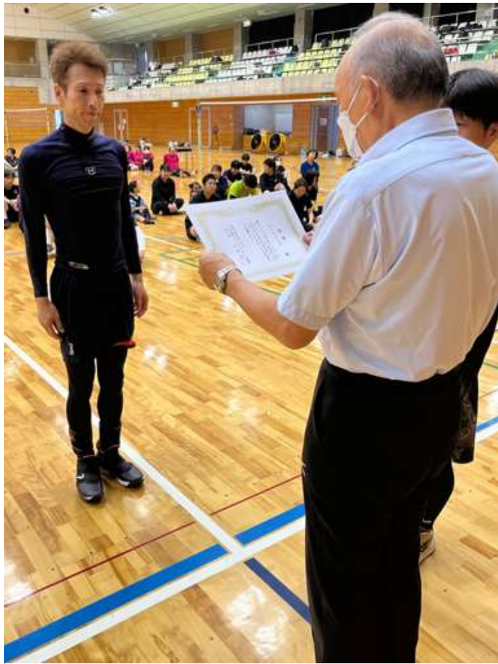
第8回全国ソフトバレー・フリーフェスティバルin八代 大分県代表 VIVACE (2023年11月11日～12日) 八代トヨオカ地建アリーナ