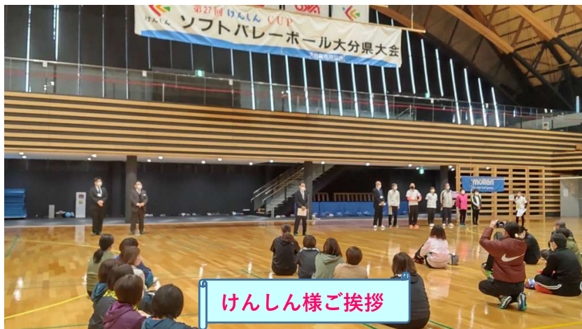
けんしん様ご挨拶