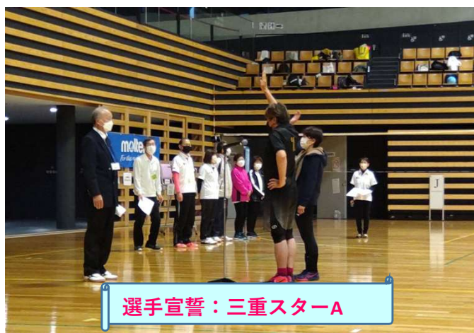
選手宣誓：三重スターA