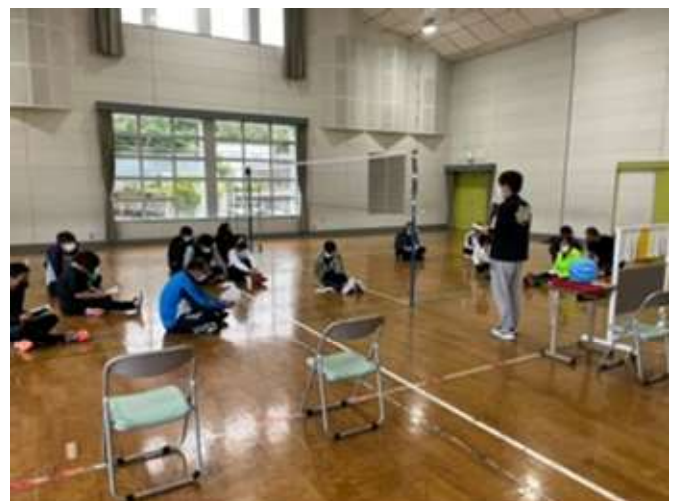
ルールブック説明